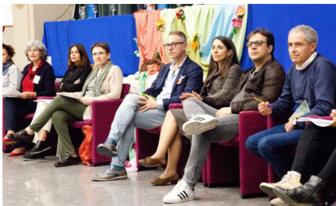
Il gruppo di fondazione della Rete Italiana Genitori durante l'incontro dei referenti

Mentre vi scriviamo, questo nostro movimento genitoriale sta proseguendo quanto condiviso dal gruppo di fondazione a Pesaro, lavorando negli ambiti regionali per individuare fra loro quei referenti che andranno a comporre il "Consiglio operativo della rete". Lo chiamiamo "nostro" poiché come rinnovato in varie occasioni e sedi, spetta a tutti noi sostenere questa nascente rete con pensieri positivi ed atti concreti affinché possa proseguire questo suo percorso di formazione e crescita completando quell'immagine triarticolata accanto di Insegnanti ed Amministratori per la salute e l'evoluzione del movimento Waldorf in Italia.