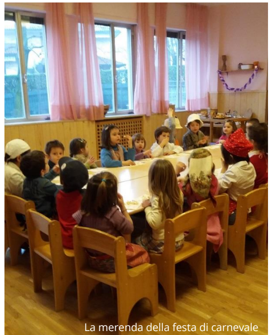
La merenda della festa di carnevale