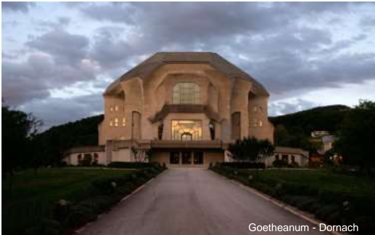
Goetheanum - Dornach

È noto a tutti che il movimento delle Scuole Steiner-Waldorf è diffuso in tutto il mondo. Forse non tutti sono però al corrente che periodicamente insegnanti di tutto il mondo si incontrano al Goetheanum di Dornach. L'occasione viene data dai convegni mondiali, come quello che si è tenuto dal 28 marzo al 2 aprile scorsi. La partecipazione degli insegnanti agli incontri di aggiornamento è uno degli elementi posti a fondamento dell'appartenenza delle scuole alla Federazione perché nell'incontro e nel confronto, non nell'autoreferenzialità, possiamo sperare di realizzare al meglio l'ideale che le nostre scuole vogliono